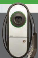
Ensto One Home

Super jednoduchá a bezpečná domáca nabíjacia stanica. To je tá pre Teba.